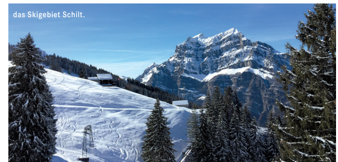
das Skigebiet Schilt.