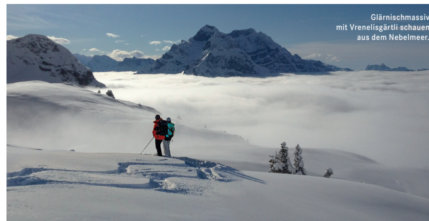
Glärnischmassiv mit Vrenelisgärtli schauen aus dem Nebelmeer.